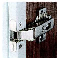
専用丁番(サリチェ社)