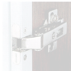
専用丁番(サリチェ社)