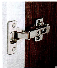
専用丁番 (サリチエ社)